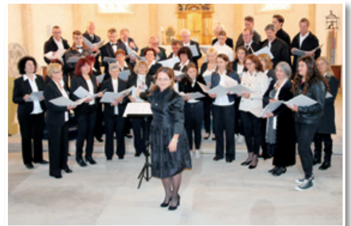
Župnijski pevski zbor župnije sv. Benedikta ob nastopu na dekanjskem srečanju župnijskih pevskih zborov v cerkvi Sv. Treh kraljev pri Benediktu