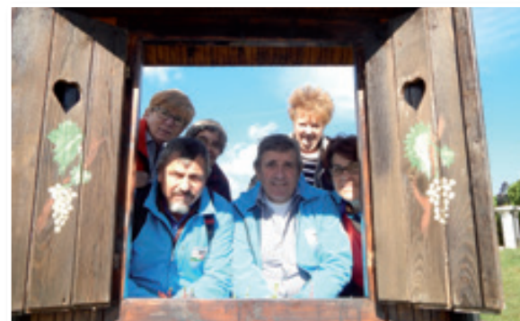
Fotografija iz akcije

Planinsko društvo Hakl Sv. Trojica se je odločilo za sodelovanje v akciji »Slovenja planinari«, ki je potekala v sodelovanju in s financiranjem Fundacije za šport Republike Slovenije, Ministrstva za izobraževanje, znanost in šport ter Olimpijskim komitejem Slovenije – združenje športnih zvez ter Planinske Zveze Slovenije. V program smo vključili sekcijo planincev, ki smo jo ustanovili to leto v domačem Društvu upokojencev Sveta Trojica. V sekciji so v večini upokojenci, ki še do sedaj niso bili člani planinskega društva. Cilj razpisane akcije pa je bil v osnovi namenjen prav starejši populaciji, ki do sedaj še ni bila nikoli vključena v eno izmed društev, ki skrbi in spodbuja aktivnejše preživetje v tretjem življenjskem obdobju. V treh izpeljanih pohodih v planinski svet, ki je bil prilagojen sposobnostim udeležencev, smo z usposobljenimi društvenimi planinskimi vodniki uspešno popeljali 23 udeležencev. V štirih mesecih, kolikor je trajala akcija, smo