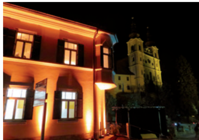
»Trojiška lepotic« bo spremenila tudi veduto kraja, še zlasti v nočnem času.