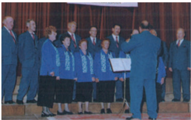
Nastop mešanega pevskega zboru DI Lenart leta 1999 na Vrhniki