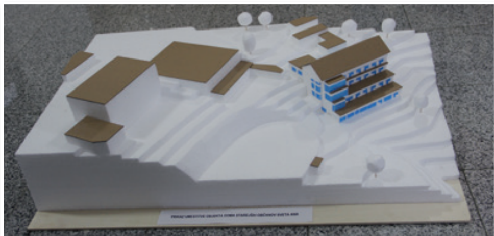
Maketa doma starejših občanov

Pričeli smo tudi s pridobivanjem gradbenega dovoljenja in izdelavo projektne dokumentacije za gradnjo doma starejših občanov