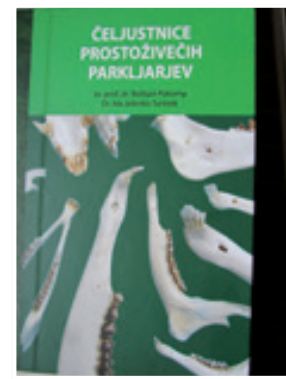
Naslovnica nove strokovne knjige LZS