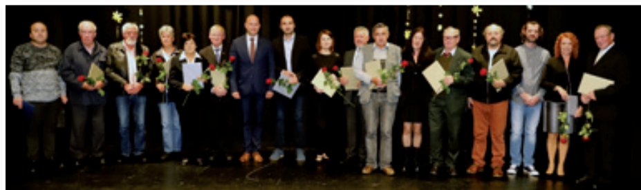
Jubilejna priznanja posameznikom in dvema institucijama