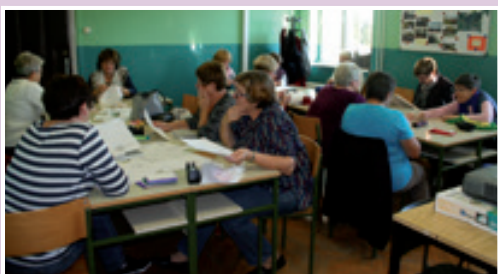
»Mojstrovalke« II. skupina