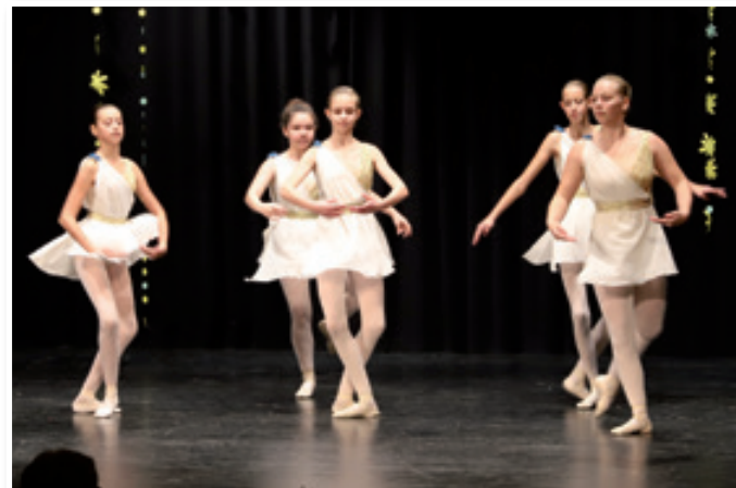
Baletke lenarške glasbene šole

zraven, da znaš, da veš, da ti že boš ...« O delu JSKD Lenart je dejala: »Naša izpostava je v svojih dvajsetih letih dokazala, da je vredna zaupanja. Stkale so se vezi. Še posebej v