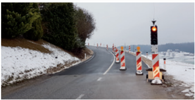
Sanacija plazov v Jurovskem Dolu je v zadnji fazi

Največja investicija v prihodnjem letu bo dokončanje projekta rekonstrukcija občinskih cest - III. faza. Prvi del projekta z rekonstrukcijo ceste Malna-Plođrščica in asfaltiranjem cestnega odseka Najdenik v Zg. Partinju je občina zaključila v minulom mesecu. Za redno vzdrževanje lokalnih občinskih cest in sanacijo manjših plazov na območju občine je predvidenih cca 140.000 €, 80.000 € za izvajanje zimske službe, 60.000 € pa za kolesarsko povezovanje kolesarskih poti na območju ORP Slovenske gorice. Med projekti, ki čaka-