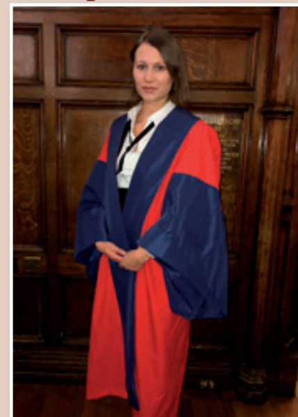
S podelitve doktorata v Oxfordu

Od leta 2012 do danes je kot raziskovalka sodelovala na številnih fakultetah v Sloveniji in tujini, med njimi na Pravni fakulteti Univerze v Oxfordu, Evropskem univerzitetnem inštitutu v Italiji, Inštitutu Maxa Plancka za primerjalno in mednarodno zasebno pravo v Hamburgu in Pravni fakulteti Univerze na Dunaju ter kot pripravnica in pravna svetovalka na Sodišču EU v Luksemburgu. Leta 2013 je opravljala delo sodniške pripravnice na Višjem sodišču v Ljubljani, v času doktorskega študija pa je raziskovalna in delovne izkušnje nadgrajevala kot asistentka in gostujoča predavateljica na Pravni fakulteti Univerze v Oxfordu, na Dunaju in na domačih fakultetah. Zdaj je zaposlena kot docentka na katedri za