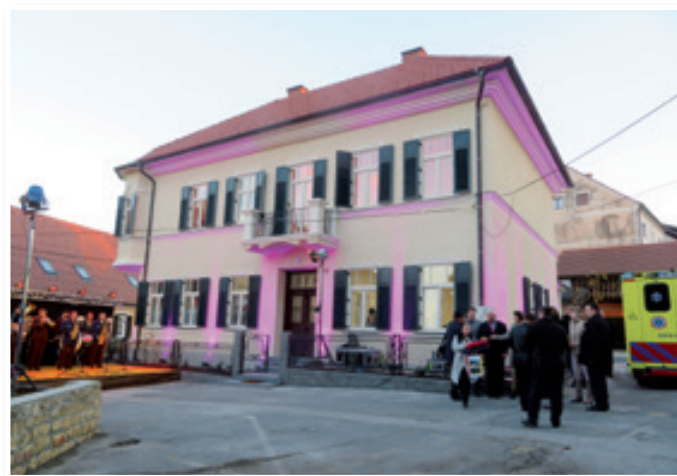
V prenovljeni stavbi na Trojiškem trgu bo domovala tudi občinska uprava.